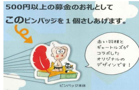
城東地区社会福祉協議会

500円以上の募金でピンバッジ1個差し上げます。公民館窓口でも取り扱っています。ご協力をお願いします。